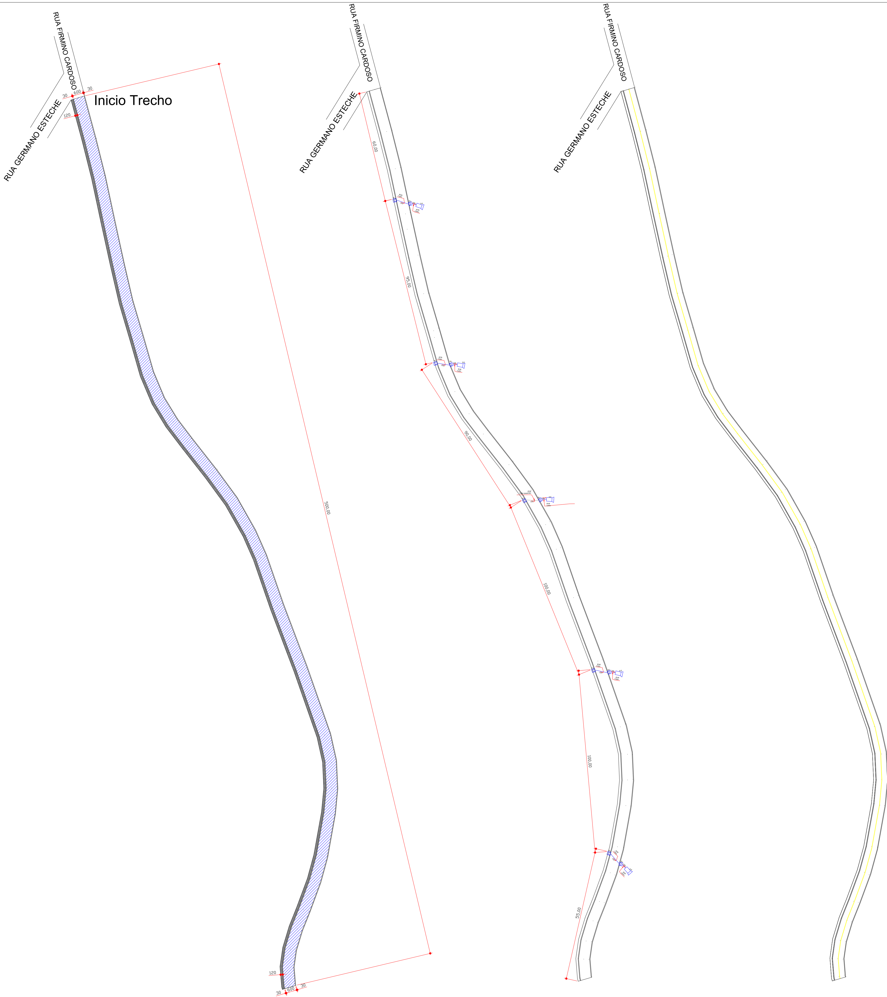
PLANTA DE PAVIMENTAÇÃO ESCALA 1:1000